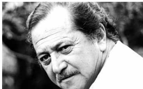
Ricardo Garibay.

Ricardo Garibay nació en Tulancingo, Hidalgo, el 18 de enero de 1923 y murió en Cuernavaca, Morelos, el 3 de mayo de 1999. Se dedicó a la escritura, el periodismo, el cine, el teatro y la televisión; fue un destacado autor de la literatura mexicana y maestro de la crónica.